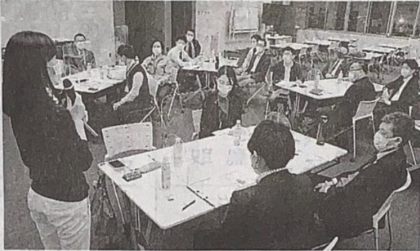
SDGsについて意見を交わす参加者 中央市役所

国連が提唱する持続可能な開発目標（SDGs）達成に向けて意見を交わす「やまなしSDGsカフェ」が中央市役所で開かれた。産官学が連携して初めて開催。SDGs達成に向けた活動を紹介し合